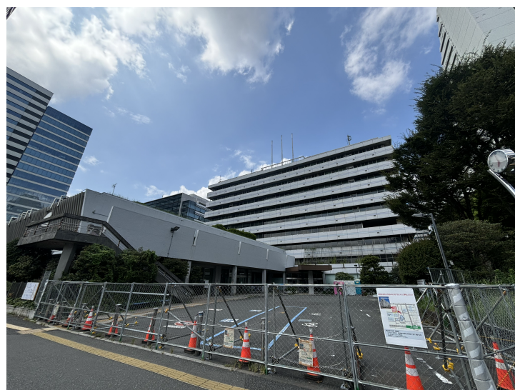
取り壊し予定の中野サンプラザや旧中野区役所など