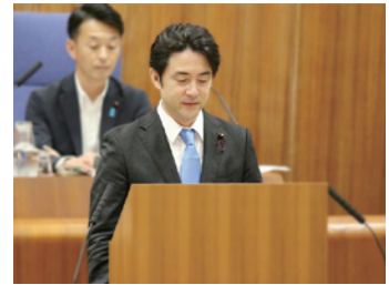
第二回定例会での質疑