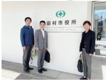
会派有志と姉妹連携している福島県田村市（旧常葉町）を表敬訪問