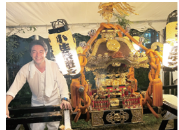
地元の氷川神社大祭に参加