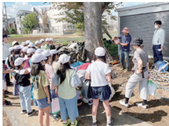
地元小学生の区内農家への体験学習を視察