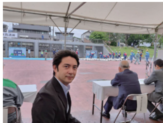
中野区・第四消防方面合同水防訓練に出席